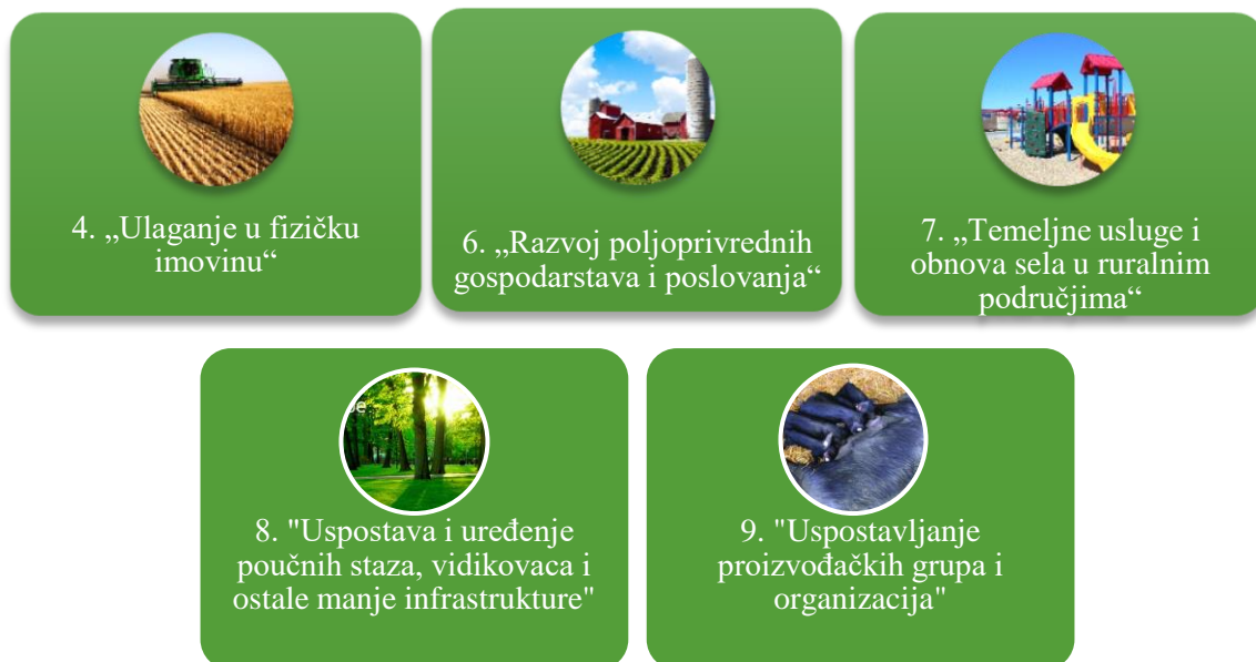
Slika 2. Mjere PRR-a 2014 - 2020