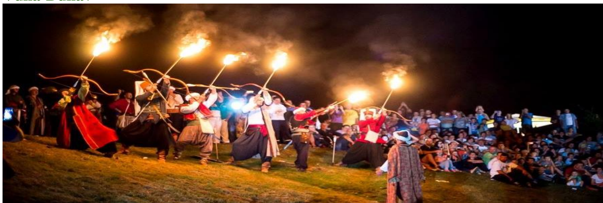
Slika 1. Manifestacija "Povratak Vitezova na Utvrdu Kolodvar" u organizaciji LAG-a Vuka-Dunav